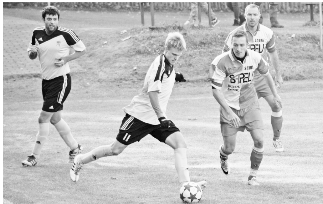
NEDAŘILO SE. Domácí výběr Sapeli Polná (vpravo se v pátečním taháku 13. kola musel sklonit před Ždírcem nad Doubravou. Hosté byli lepší a vyhráli 3:1.